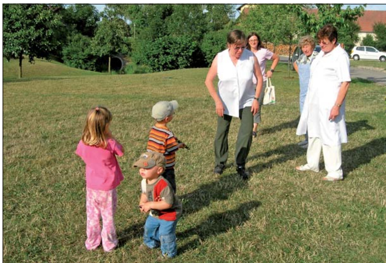
Alle Generationen fühlen sich in Iber wohl. Ganz selbstverständlich wachsen Kinder in die Dorfgemeinschaft hinein.