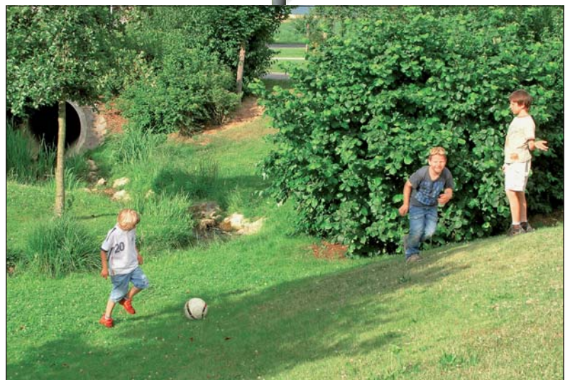
Viel Raum zum Spielen haben die Kinder auf den Wiesen rund um den Leherbach und am Spielplatz in der Dorfmitte.